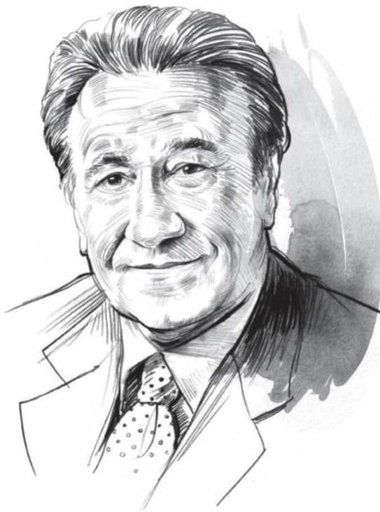
奥拉·罗伯茨 (Oral Roberts, 1918–2009)

信心话语运动是一场普世福音运动，教导人有能力透过言语使事情成真。该运动经常跟五旬节和灵恩运动联系在一起，信心话语运动认为，人被造有神的形象，因此自身也是创造者，可以如神一样透过言语实现创造活动，就像神在创世时所做的一样。该运动鼓励信众面对自己的环境说积极的话语，也要求他们永远不要发出消极的言语，这么做会让坏事成真。凯尼恩(E. W. Kenyon)经常被视为该教训的鼻祖，哈金(Kenneth Hagin)则是它的主要倡导者。