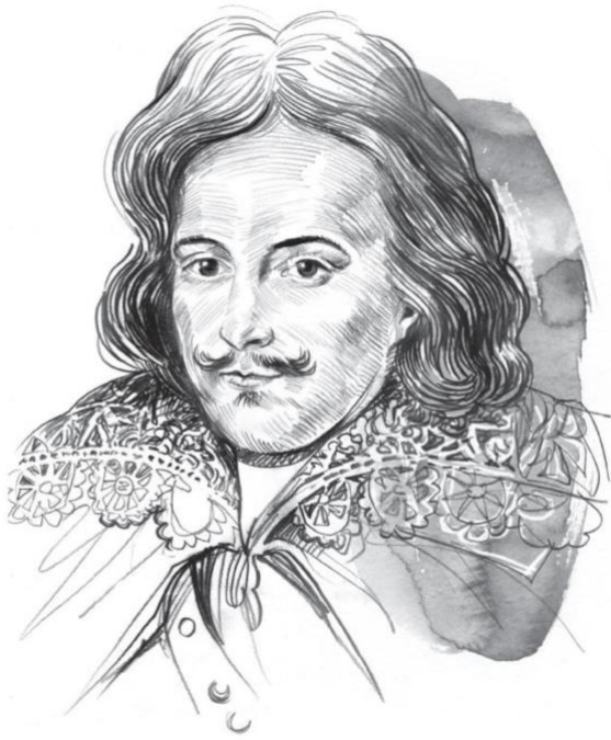
爱德华·赫伯特 （Edward Herbert, 1583 - 1648）